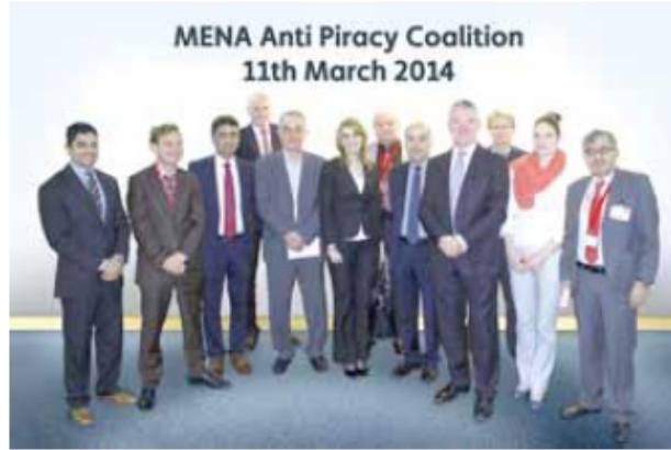
■ التحالف ضد القرصنة يتبنى منهجا شاملا لوقف قنوات القرصنة

وفي الوقت الذي تنتشط فيه العديد من مؤسسات البث التلفزيوني للمساهمة بمحاربة القرصنة، يؤكد تأسيس «التحالف ضد القرصنة» على الحاجة المتنامية للتعريف بالأثار السلبية لكافة أشكال القرصنة. وفيما مضى كان تأثير القرصنة يطول مشغلي القنوات التلفزيونية المدفوعة، ولكنها اليوم تضع كامل قطاع البث الإذاعي والتلفزيوني في الشرق الأوسط وشمال أفريقيا في دائرة الخطر. وسوف يعمل «التحالف ضد القرصنة» على تبني منهج شامل، والعمل مع كافة مشغلي الأقمار الصناعية والمعلنين والاستديوهات ومحطات البث الراغبين بالتعاون لوقف قنوات القرصنة ■