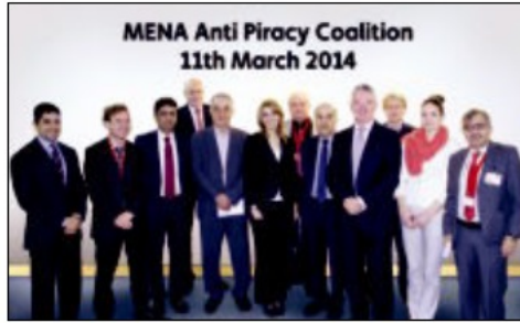
مسؤولو الجهات المؤسسة للتحالف

وتابع أن «التحالف ضد القرصنة» سيعمل على تبني منهج شامل، والعمل مع كافة مشغلي الأقمار الصناعية والمعلنين والاستديوهات ومحطات البث الراغبين بالتعاون لوقف قنوات القرصنة.