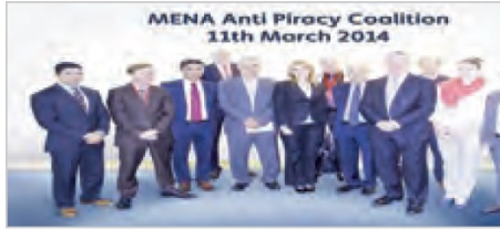
لقطة تذكارية تجمع ممثلي التحالف